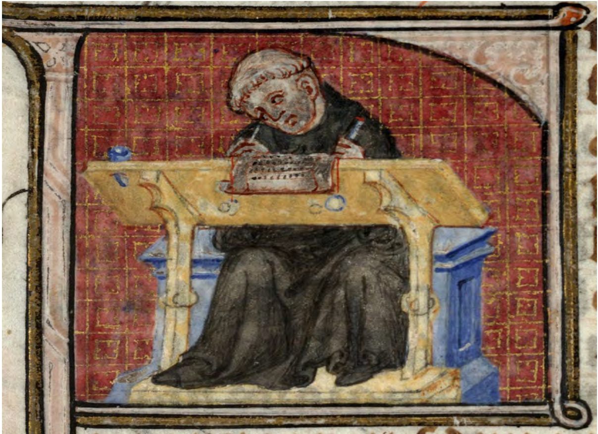
Recueil. XIII e -XIV e siècle. (H 195, fol.1). Moine écrivant à son pupitre.

près avoir observé l'illustration ci-dessous, remplacez les mots suivants dans le texte à trous.