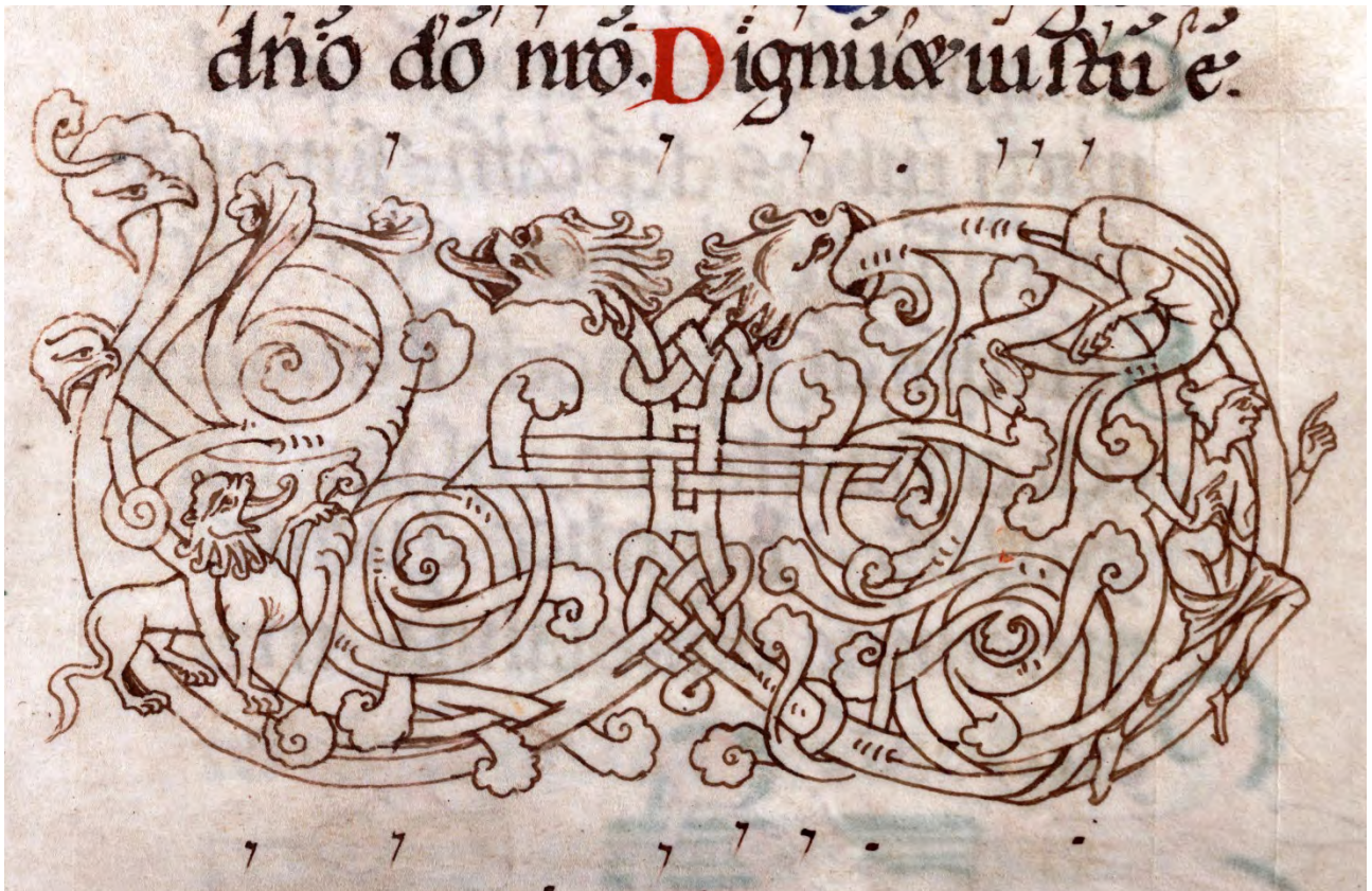
Missel*. XI e siècle. (H 314, fol. 14 r)

et ornement est tiré d'un Missel , livre qui contient les prières de la messe. Combien de figures animales et humaines voyez-vous? Vous pouvez colorier cet ornement à la maison.