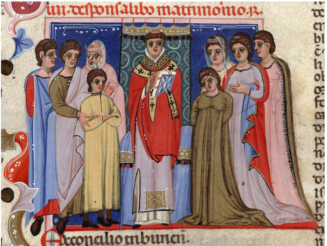
Raymond de Pennafort, Décrétales* de Grégoire IX . XIV e siècle. (H 9, fol. 169 r)

ette miniature* orne l'un des manuscrits les plus abondamment illustrés de l'exposition. C'est un exemplaire des Décrétales de Grégoire IX , recueil de droit canon* rassemblant lois et règlements de l'Église. Quel événement, à votre avis, est représenté sur cette miniature ? Justifiez votre réponse.