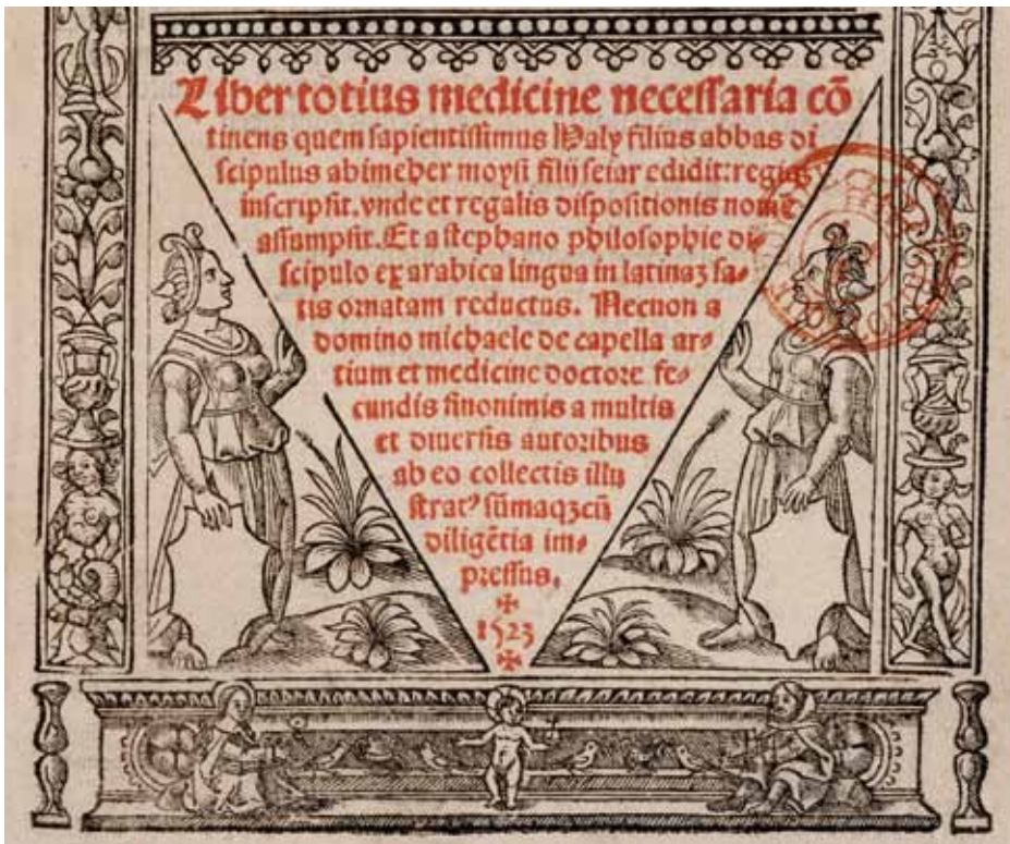
Haly Abbas, Liber totius medicine necessaria continens , 1523. L'estampille de la bibliothèque royale est une trace des échanges de doubles dans les collections rassemblées par Prunelle.

La bibliothèque de l'École de médecine de Montpellier prend forme à une période charnière entre un encyclopédisme hérité des Lumières et le début de la mise en œuvre de techniques très modernes de gestion de ce type de collection. Créer une bibliothèque performante implique de disposer de locaux équipés pour rassembler des livres, avant de mettre au point un catalogue pour qu'ils puissent être utilisés par le public. Il faut en outre organiser l'ouverture de la salle de lecture, grâce à du personnel dédié.