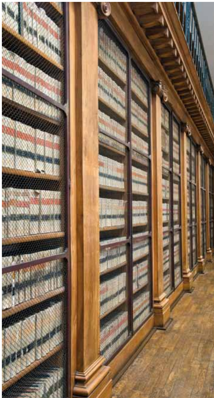
Rayonnages de la salle de lecture dite salle Prunelle : les thèses de médecine

Les collections d'ouvrages scientifiques disponibles dans le Midi de la France sont numériquement limitées à la fin de l'Ancien Régime, ce qui donne lieu à des stratégies complexes pour se procurer les bibliothèques de collectionneurs privés et d'amateurs de science au moment des successions. Ce contexte explique pourquoi la redistribution des collections pendant la Révolution constitue une opportunité sans précédent pour l'École de médecine de Montpellier ainsi que pour nombre d'autres grandes institutions françaises.